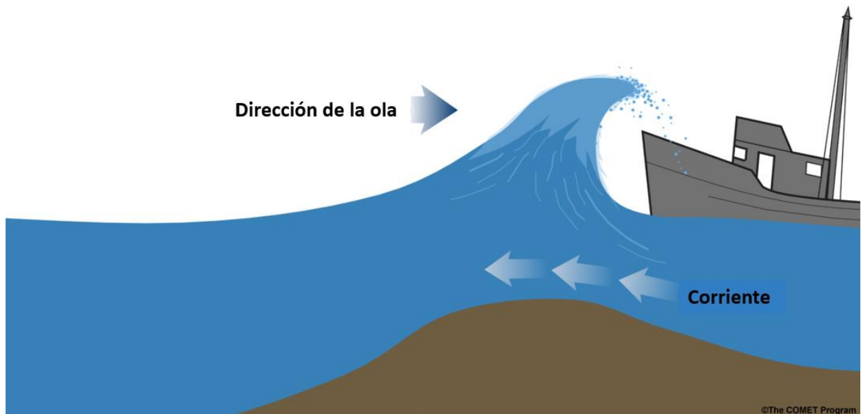
Figura 3. Esquema simplificado del efecto Doppler que experimenta el oleaje al transitar por una zona de bajos, o en aguas someras, cuando una corriente de cierta intensidad tiene sentido contrario, reforzando la altura y la pendiente de las olas en el proceso de rotura.

Es muy importante tener en cuenta que en estas embarcaciones, al tener menos de 20 TRB, los criterios de estabilidad son distintos a los que la normativa requiere a los pesqueros de más de 20 TRB. Por ejemplo, no se exige a estas embarcaciones tener un libro de estabilidad que permita conocer a los patronos la forma adecuada de operar y cargar el pesquero para garantizar la estabilidad del mismo. Además, su vulnerabilidad se incrementa enormemente cuando se encuentran fondeadas o en operaciones de cobrado de las artes de pesca. En estas condiciones aumenta el riesgo de naufragio por la amenaza que para la embarcación supone la drástica reducción de su estabilidad al haber quedado fijada al fondo mediante cabos o artes de pesca. Por tanto, estas operaciones deben ser abordadas con suma prudencia para evitar los golpes de mar que puedan ocasionar embarques masivos de agua en la embarcación.